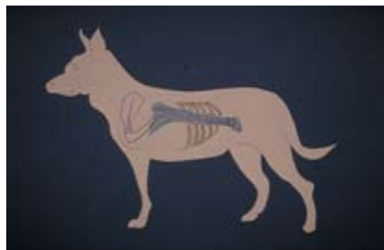
Abb. 4 Lagebeziehung der angewinkelten Vorderextremität zum Rumpf

Der entstandene Defekt hat ein Ausmaß von 10 cm Länge und 5 cm Breite. Zur Deckung wird ein Hautlappen mit ventraler Basis aus der linken ventrolateralen Bauchregion epifaszial mobilisiert (Abb. 3). Um die Lagebestimmung und Anzeichnung von optimaler Lappenlage und -größe vornehmen zu können, erfolgt eine Rücklagerung der Extremität an den Rumpf (Abb. 4). Danach wird die Umschneidung des Lappens im Verhältnis von Breite zu Länge wie 1:2 vorgenommen (Abb. 5).