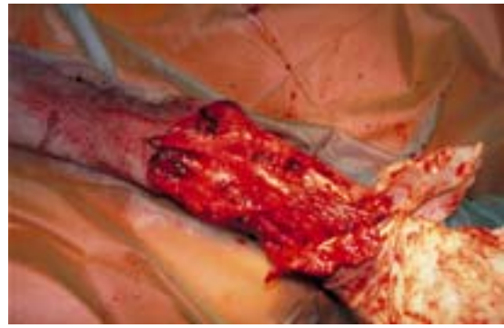
Abb. 2 Operationswunde mit Verlust der Phalanx I und des Karpalballens

Nach Scheren, Desinfektion und steriler Abdeckung der Vorderextremität sowie der linken Bauchwand erfolgt die Entfernung des Tumorrezidivs mit Resektion aller makroskopisch sichtbaren, vom Mastozytom infiltrierten Strukturen in Esmarch'scher Blutleere. Hierbei werden die Phalanx I, der Karpalballen, distale Anteile der oberflächlichen Beugesehne und der V. cephalica antebrachii, Gelenkkapselanteile des Karpometakarpalgelenks und umliegende Hautanteile weiträumig entfernt (Abb. 2). Nach sorgfältiger Blutstillung (elektrochirurgische Koagulation und Fulguration sowie Ligatur von Blutgefäßen) ist die Operationswunde nach der Abnahme des Esmarch-Schlauchs frei von Blutungen.