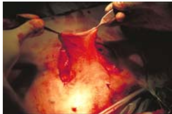
Abb. 3 Mobilisierter Hautlappen ventral aus der Bauchhaut zur Deckung des Primärdefektes medial am Karpus

Der entstandene Defekt hat ein Ausmaß von 10 cm Länge und 5 cm Breite. Zur Deckung wird ein Hautlappen mit ventraler Basis aus der linken ventrolateralen Bauchregion epifaszial mobilisiert (Abb. 3). Um die Lagebestimmung und Anzeichnung von optimaler Lappenlage und -größe vornehmen zu können, erfolgt eine Rücklagerung der Extremität an den Rumpf (Abb. 4). Danach wird die Umschneidung des Lappens im Verhältnis von Breite zu Länge wie 1:2 vorgenommen (Abb. 5).