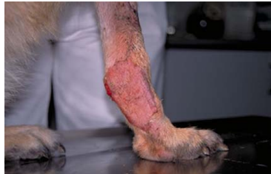
Abb. 20 Transplantat zehn Tage nach Durchtrennung des Lappenstiels, Ansicht von medial

komplikationslose Ausheilung und ein zügiges Nachwachsen der Haare (Abb. 20). Trotz des Verlustes der oberflächlichen Beugesehne bleibt nur eine geringgradige Bewegungsstörung mit leicht plantigrader und gespreizter Fußung zurück.