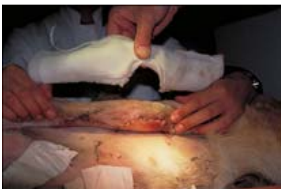
Abb. 12 Anpassung des immobilisierenden Schalenverbandes mit transplantatseitiger Aussparung