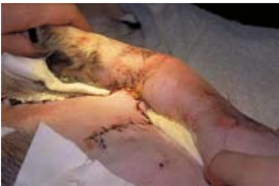
Abb. 16 Verbandwechsel am dritten Tag, Ansicht von dorsal