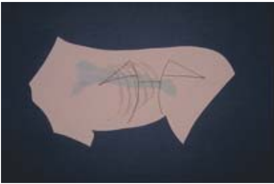
Abb. 5 Schnittführung zur Bildung des ventralen und dorsalen Lappens sowie Exzision der Burow-Dreiecke