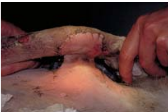
Abb. 17 Verbandwechsel am siebten Tag, Ansicht von ventral

Bei den letzten drei Verbandwechseln wird der Lappenstiel für fünf bis zehn Minuten mit einer Darmklemme komprimiert. Dieses Vorgehen dient der Förderung und Konditionierung der Neovaskularisierung des