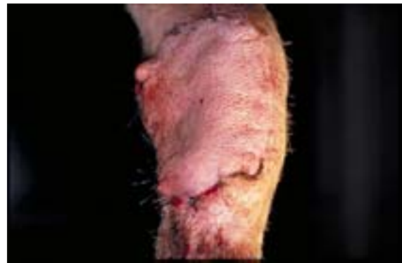
Abb. 18 Transplantat nach Durchtrennung des Lappenstiels

Neunzehn Tage nach dem Anlegen der Lappenplastik wird der Lappenstiel in Allgemeinanästhesie durchtrennt. Die Schnittebene wird dabei so gewählt, dass der Wundverschluss an der Extremität spannungsfrei erfolgen kann (Abb. 18). Die an der Bauchwand liegenden Wundränder werden routinemäßig verschlossen. Für weitere sieben Tage werden zum Schutz vor mechanischen Irritationen gepolsterte Verbände an Pfote und Unterarm der jetzt belastbaren Vorderextremität angelegt.