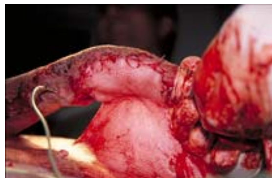
Abb. 9 Vollständig adaptierter Hautlappen mit Saugdrainage

Nach dem Anlegen aller Hautnähte wird die bisher manuell nach kaudal gehaltene Vorderextremität in leichter Flexionshaltung des Karpalgelenks mit einer den anatomischen Strukturen folgenden gepolsterten Kunststoffschale stabilisiert (Scotchcast™ One-Step, 7,6 × 30,4 cm). Die