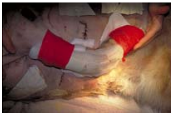
Abb. 13 Angelegte Kunststoffschale mit Verbandanordnung