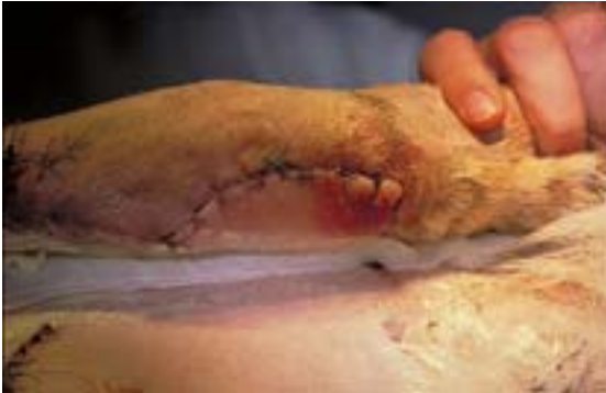
Abb. 15 Verbandwechsel am dritten Tag, Ansicht von ventral

Während der ersten fünf Tage werden die Verbände täglich, danach im zweitägigen Rhythmus gewechselt (Abb. 15-17). Für die ersten drei Verbandwechsel wird die Hündin anästhesiert, für die folgenden Verbandwechsel reicht die Sedation aus.