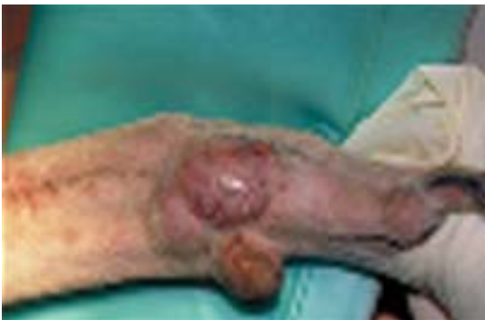
Abb. 1 Rezidiv eines Mastzelltumors medial am Karpus

An der medialen Fläche des linken Karpus befindet sich ein schnell expandierendes, nicht verschiebliches Rezidiv eines Mastzelltumors (Abb. 1). Histologisch handelt es sich um ein Mastzellsarkom mit hoher Variabilität, Anisozytose und Anisokaryose, wechselndem Gehalt an Mastzellgranula sowie zahlreichen Mitosen und Infiltrationen mit eosinophilen Granulozyten. Der Tumor ist histologisch mit seinem anaplastischen, unreifen und undifferenzierten Zellbild als Grad II zu klassifizieren.