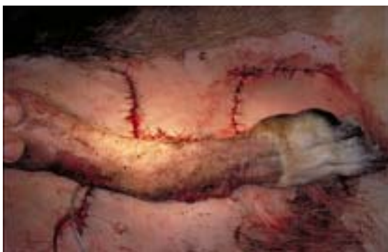
Abb. 10 Situation nach Wundverschluss

Polsterung verhindert hierbei das Auftreten von druckbedingten Ischämien (Abb. 12). Der Schalenverband liegt dem Unterarm und der Pfote kranial an (Abb. 13). Die Fixation in leichter Beugehaltung vermeidet eine Beeinträchtigung der Lappenperfusion durch Überdehnung oder Stauchung des Lappens. Unter Schonung des Lappenstiels wird die streckseitig verbundene und geschiente Extremität pfoten nah sowie un-