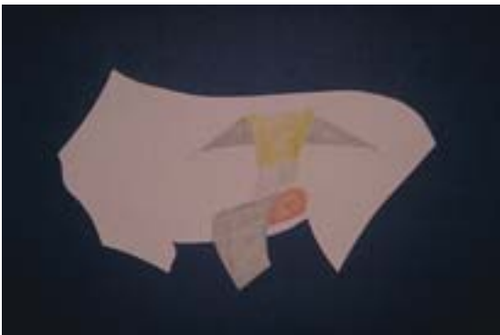
Abb. 7 Hebedefekt

Der so gewonnene gut vaskularisierte Hautlappen (Abb. 6) wird mit seinem dorsalen Rand an der kраниomedialen Defektklinie des Karpus mit Einzelknopflehten (Ethilon® 1,5 metric, 4-0) adaptiert. Situationsnähte passen den Hautlappen transversal spannungsfrei, allseits dem Wundgrund am Karpus aufliegend, in den Defekt ein. Mit dem Erreichen der Umschlagfalte des Lappens am kaudomedialen Defektrand wird dieser mit Einzelknopflehten in locker adaptierender Technik spannungsfrei fixiert.