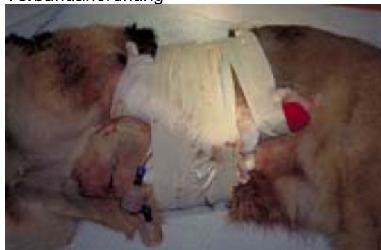
Abb. 14 Fixation der angewinkelten Extremität

mittelbar unterhalb des Ellenbogengelenks nach ventral mit einem Textilklebeband (Tesa® Nr. 4541) an der zuvor geschorenen Bauchhaut fixiert. Nach dorsal gerichtete Tesa®-Bandagen auf geschorenen Hautstreifen sichern die vollständige Ruhigstellung des Schultergelenks und stabilisieren die immobilisierte Vorderextremität gegen den Rumpf, sodass den Lappen gefährdende Zug- und Scherkräfte am Lappenstiel vermieden werden (Abb. 14).