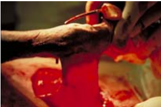
Abb. 6 Adaptation des ventralen Bauchhautlappens an der kраниomedialen Defektklinie