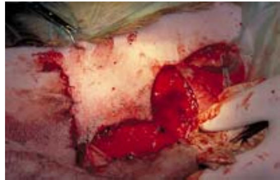
Abb. 8 Mobilisierter Hautlappen aus der dorsalen Bauchhaut zur Deckung des Hebedefektes

Zur Vermeidung einer Ansammlung von Seromflüssigkeit werden in die Wundhöhle des Karpus und im Bereich des Hebedefektes zwei Redon-Saugdrainagen gelegt (Redon-mini-set, Ch 06).